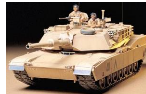
Immagine indicativa della versione Americana 35156

Dopo la presentazione del Leopard 2 A6 Tank nella livrea "Ukraine", Tamiya è lieta di annunciare il carro M1A1 Abrams "Ukraine" con parti stampate e accessori dall'articolo 35156 M1A1 Abrams 120mm Gun Main Battle Tank, più decalcomanie raffiguranti la croce bianca e la bandiera dell'Ucraina, una guida alla verniciatura e nuova confezione completano il modello. Nel gennaio 2023, il governo degli Stati Uniti ha deciso di inviare 31 carri armati principali M1 Abrams. Si dice che questi carri armati dovrebbero essere inviati intorno a questo autunno dopo le modifiche e l'addestramento dell'equipaggio. Caratteristiche del modello: • Kit di montaggio del modello in scala 1/35. • La forma potente dell'M1A1 Abrams è fedelmente riprodotta.