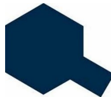
ACCESSORI Limited Edition

Carrozzeria di ricambio per la Fiat 131 Abarth RC in scala 1:10. La carrozzeria in policarbonato trasparente riproduce fedelmente la Fiat 131. Parti aggiuntive in plastica ABS per aggiungere dettagli. Stickers e foglio mascheratura inclusi.