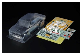
RICAMBI RC 1:10