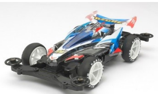
mini4WD-PRO Limited Edition

TA95464 AVANTE MKIII POLIC. Riedizione della "Clear Special" della Avante Azure Mk.III. Il modello utilizza il telaio MS della linea PRO caratterizzata dal motore centrale a doppio pignone. La carrozzeria in policarbonato trasparente fornisce al modello un aspetto unico. Motore doppio pignone incluso. Una vasta serie di accessori disponibili.