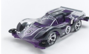
mini4WD-PRO Limited Edition

TA95464 AVANTE MKIII POLIC. Riedizione della "Clear Special" della Avante Azure Mk.III. Il modello utilizza il telaio MS della linea PRO caratterizzata dal motore centrale a doppio pignone. La carrozzeria in policarbonato trasparente fornisce al modello un aspetto unico. Motore doppio pignone incluso. Una vasta serie di accessori disponibili.