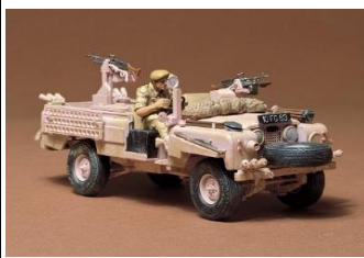
1:35 Limited Edition

Versione Limited Edition per il Mitsubishi G4M1 model 11 in scala 1:48 nella livrea per il trasporto dell'Ammiraglio Yamamoto. Il kit include 17 figure per renderlo perfetto per diorami. • La forma tubolare del G4M1 è realisticamente riprodotta. • La cappottina sopra il sedile del pilota sul lato sinistro, la torretta dorsale e i lembi dell'aereo possono essere raffigurati aperti o posizione chiusa. • Include diciassette figure in totale: una raffigurante l'Ammiraglio Yamamoto, un osservatore, due piloti, uno artigiere e dodici meccanici. • Viene fornito con due opzioni di contrassegno: i trasporti dell'Ammiraglio Yamamoto e del vice ammiraglio Ugaki.