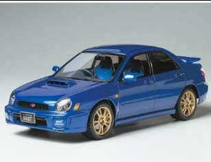
1:24 Limited Edition