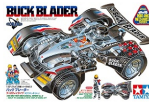
TA95532 BUCK BLADER modello Statico - Limited Edition

Gli appassionati la riconosceranno! Il modello originale venne rilasciato nel 1997. Con carrozzeria trasparente che permette di vedere i dettagli interni del modello. Sono incluse parti metalliche separate per ricreare i dettagli del telaio interno e della ventola.