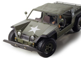
TA 58004 XR311 Combat Support

Avete davanti la Riedizione del PRIMO modello R/C con sistema di sospensioni Tamiya (1977). La carrozzeria cattura l'aspetto deciso del veicolo. Le parti interne e la figura di guida sono incluse. Il telaio è in Duralluminio