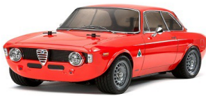
TA 58486 Alfa Giulia GTA (M-06)

Questo kit di assemblaggio ricrea la classica Alfa Romeo Giulia Sprint GTA in forma da corsa. Il telaio M-06 ha il motore montato sul retro. Trazione posteriore con le unità R/C posizionate su entrambi i lati per un equilibrio ottimale e un baricentro basso.