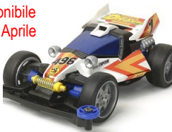
TA 18074 PROTO EMPEROR Super II - Ltd Ed.