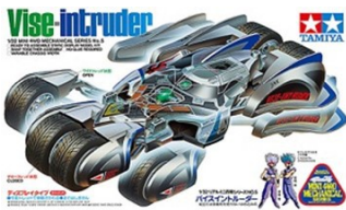
TA95534 VISE- INTRUDER modello Statico - Limited Edition

Il super futuristico Vise-Intruder di nuovo con noi! Il modello ha ruote anteriori orientabili, la carrozzeria trasparente per vedere all'interno tutti i dettagli. La sezione centrale del corpo può essere usata su alcuni telai (Super X, Super TZ e Super-1) per creare un modello funzionante.