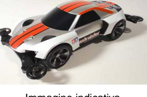
Immagine indicativa mini4WD-PRO

Esclusiva versione in edizione Limitata della Avante nella livrea Violet Special con carrozzeria in policarbonato trasparente. Il modello utilizza il telaio AR delle mini4WD-PRO. Una vasta serie di Optional permettono la personalizzazione.