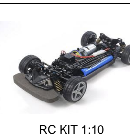
RC KIT 1:10

Foglio adesivi con i loghi dei modelli della serie "Let's & Go!" realizzati da Tamiya per celebrare il 20° anniversario delle Fully Cowled. Realizzato in edizione limitata è perfetto per personalizzare la vostra mini4WD. Misure 110x170mm.