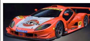
Immagine campione RICAMBIO

Carrozzeria da verniciare del modello Nissan GT-3 2007. Include stampi separati per specchietti e parabole luci.