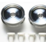
NOVITA' ricambi mini4wD