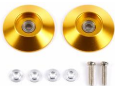
Worldwide Sales 20/08

Queste sono versioni leggere da 19mm delle famose rotelle da corsa in alluminio da 17 mm, con cuscinetti a sfera integrati 520 per una scorrevolezza superiore. Questi componenti sono circa il 25% più leggeri del design di base.