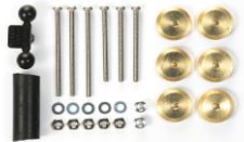
NOVITA' ricambi mini4wD

La versione speciale del motore Hyper-Dash 3 rilasciata per Japan Cup 2020. Il motore offre prestazioni altamente efficienti, durevoli ed equilibrate grazie alle spazzole di carbone d'argento.