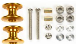
Worldwide Sales 20/07

Riedizione dei cerchi distribuiti nel 2013. Aggiungeranno un po' di peso alla tua Mini 4WD, per un baricentro inferiore. Prova a montare i cerchi solo sul lato anteriore o posteriore per avere effetti diversi sulle prestazioni.