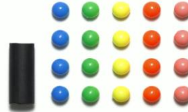
Disponibile da metà Luglio

I mass damper sono indispensabili sui percorsi con numerosi cambi di quota. Il set comprende 6 pesi e sono incluse anche viti da 2x25mm e 2x30mm, distanziali in alluminio da 3mm, sfere stabilizzatrici.