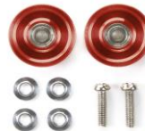
NOVITA' ricambi mini4wD