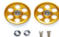
Worldwide Sales 20/07

Rotelle in alluminio doppie alleggerite. Diametro 12 mm nella parte superiore e 13 mm nella parte inferiore. Questa combinazione migliora notevolmente la stabilità delle macchine e aiuta anche le capacità in curva. 20% più leggero.