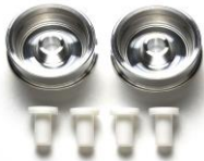
NOVITA' ricambi mini4wD