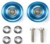
NOVITA' ricambi mini4wD