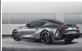
Immagine Indicativa KIT RC 1:10

Il telaio WR-02CB è divenuto popolare grazie alla linea Comical. Un nuovo modello si aggiunge alla linea. La Comical Frog viene fornita con ammortizzatori idraulici, gomme block posteriori e rigate anteriormente con cerchi in 2 parti. Motore e reg. inclusi.