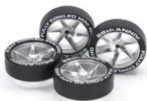
ACCESSORI mini4WD Limited