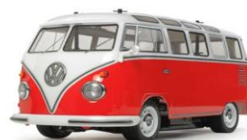
KIT RC 1:10 Limited Edition