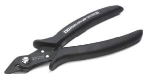
Immagine versione Black ATTREZZI Limited Edition

Questo kit permette la realizzazione di un Robot cingolato che funziona utilizzando un bbc micro bit. Grazie al sensore ad ultrasuoni che identifica ostacoli ed invia i dati al micro bit il modello evita gli ostacoli. Il programma pre-installato può essere codificato attraverso applicazioni con PC.