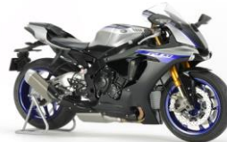
Montata 1:12 Limited Edit.