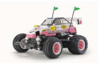
KIT RC 1:10