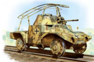
KIT 1:35 Limited Edition

Splendida riproduzione montata e decorata direttamente da Tamiya della Yamaha YZF-R1M. Il modello MasterWork è rifinita nei minimi dettagli anche grazie all'utilizzo dell'optional forcella e ulteriori particolari.