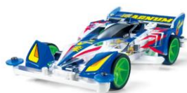
mini4WD Limited Edition

Nuova versione per il Veicolo Light Armored di difesa utilizzato dalle Forze Giapponesi. Il kit include nuove parti per i telai finestre, figura autista della recente uniforme JGSDF, portapacchi posteriore, antenne e decal.