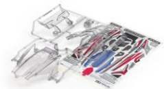
RICAMBI mini4WD Limited Ed.