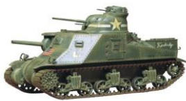
1:35 Limited Edition