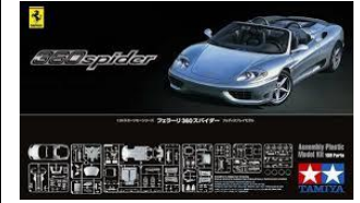
KIT 1:24 Limited Edition