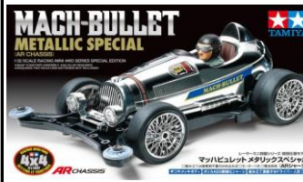
mini4WD-PRO Limited Edition

La Pig Racer utilizza il body della Silwolf nella livrea Clear Rosa con inclusa la figura del maiale verniciato ed un set di adesivi specifici. Telaio MA magenta, cerchi rosa con gomme b.p. bianche. Torque-tuned incluso.