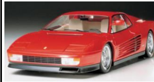
KIT 1:24 Limited Edition

Fedele riproduzione in scatola di montaggio, scala 1:6, della moto Honda Dax Export 70, conosciuta anche come Trail 70, caratterizzata dal telaio monotubolare e dalle gomme piccolo diametro. Sella elevabile. Decal Cartograf incluse.