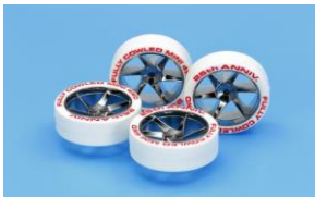
RICAMBI mini4WD Limited Ed.