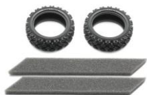
OPTIONAL RC 1:10