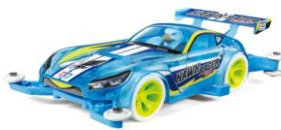
Immagine indicativa clear blu mini4WD-PRO Limited Edition

Il catalogo Tamiya illustra tutto l'assortimento dei modelli statici e relativi accessori come colori ed attrezzi. Una sezione del catalogo illustra tutto l'assortimento delle mini4WD e dei camion RC.