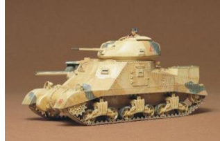
1:35 Limited Edition