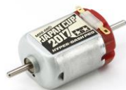
Immagine versione 2017 RICAMBI mini4WD

Versione celebrativa della J-Cup 2018 per il motore Hyper Dash 3. Compatibile con tutti i telai delle mini4WD, escluse le versioni PRO. Il motore sviluppa 21.200 giri con una coppia di 1,9mN.m.