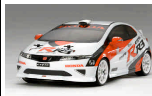
RC KIT 1:10

Il settore corse di Tamiya TRF "Tamiya Racing Factory" presenta l'ultima versione del telaio Touring da competizione a 4 ruote motrici con trasmissione a doppia cinghia. Impianto radio e carrozzeria venduti separatamente.