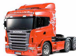
Immagine modello completo

Verione RTR della Sand Scorcher 2010 montata, verniciata, decorata e completa di radiocomando 27Mhz FM. Meccanica completamente cuscinettata ed ammortizzatori idraulici installati in fabbrica. Batteria e CB venduti a parte.