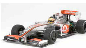
Immagine modello completo

Carrozzeria da verniciare del modello Endless 370Z. Il set include: Body, stampo separato per specchietti e sede led per predisposizione luci e stickers con foglio mascheratura. Compatibile con tutti i telai Touring passo standard.