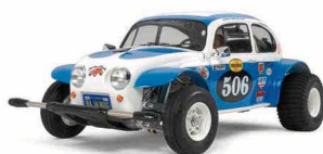
RC MONTATA 1:10

Fedele riproduzione radiocomandata con motore elettrico della Honda Civic nella versione Type-R R3. Il modello utilizza il nuovo telaio 2WD FF-03 con trasmissione anteriore. Differenziale anteriore a sfere incluso. Impianto Radio venduto a parte.