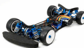
RC KIT 1:10

Rotelle, con cuscinetti, in alluminio da 19mm dotate di anello in plastica colore arancio. Il set include 2 rotelle con viti e rondelle per l'installazione. Queste rotelle incrementano la velocità e stabilità del modello in curva.