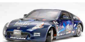
Immagine modello completo

Questo set include la carrozzeria della motrice 3 assi Scania R620 da verniciare. Compatibile con i modelli: 56323 "Scania 3 Assi R620" e 56325 "Man TGX 26540 6X6 XLX". Non compatibile con motrici 2 Assi.