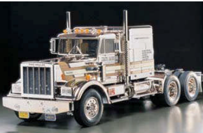
RC KIT 1:14

La splendida Lamborghini Gallardo, in versione scatola di montaggio, utilizza il telaio 4WD con trasmissione cardanica TT-01E. Il kit include regolatore elettronico TEU104BK. Vasta serie di Optional permettono la personalizzazione.