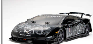
RC KIT 1:10

Versione montata e completa di radiocomando della Alfa Romeo MiTo color Rosso Alfa. Il modello utilizza il telaio, 2WD trazione anteriore, M-05. Vasta serie di Optional permettono la personalizzazione del modello.