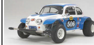
Immagine Indicativa RICAMBI RC

Versione Metallic della motrice King Hauler Americana. Cambio 3 marce incluso. Il modello prodotto in edizione limitata differisce dalla versione originale per la carrozzeria con effetto Metallic. Impianto RC venduto separatamente.