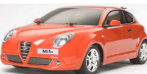
RC MONTATA 1:10

Set di 12 fermi per i cerchi in alluminio utilizzati dalle mini4WD. Il kit include 12 fermi in 3 differenti colori: Oro, Blu e rosso. Utilizzabili con tutti i modelli di mini4WD che dispongono del set cerchi in alluminio.