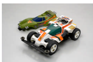
TA 94668 DASH-0 HORIZON