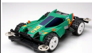
TA 18628 DASH-2 BURNING SUN