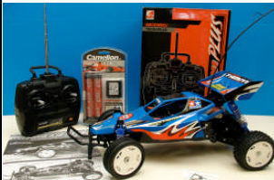
TA 58416 RISING FIGHTER