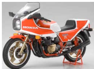
TA 16033 HONDA CB1100R (B)

Prodotta in 1000 esemplari da Honda negli anni 70.