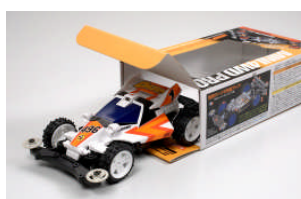
TA 94670 DASH-1 EMPEROR