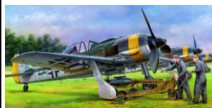
TA 61104 FOCKE-WULF FW190