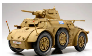
TA 89778 VEICOLO ITALIANO