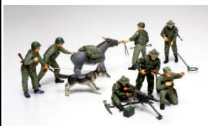
TA 89779 FANTERIA SOVIETICA