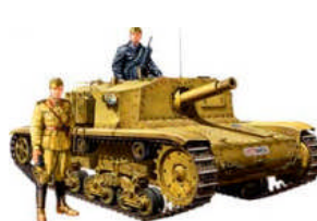
TA 35294 CARRO ITALIANO