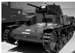
TA 35296 CARRO ITALIANO