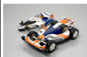
TA 94669 DASH-001 GREAT